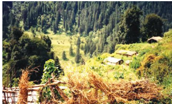
चित्र 16.2 वन्यजीवन का एक दृश्य

उद्योग इन वनों को अपनी फैक्ट्री के लिए कच्चे माल का स्रोत मात्र ही मानते हैं। निहित स्वार्थ से लोगों का एक बड़ा वर्ग सरकार से उद्योगों के लिए कच्चे माल को बहुत कम मूल्य पर प्राप्त करने में लगा रहता है। क्योंकि स्थानीय निवासियों की अपेक्षा इन व्यक्तियों की पहुँच सरकार में काफी ऊपर तक होती है, अतः उन्हें उस क्षेत्र के संपोषित विकास में कोई रुचि नहीं होती। उदाहरण के लिए, किसी वन के टीक के सभी वृक्षों को काटने के बाद, वे दूरस्थ वनों से टीक प्राप्त करने लगेंगे। उन्हें इस बात से कोई मतलब नहीं है कि वे इनका इष्टतम उपयोग सुनिश्चित करें जिससे कि वह आगे आने वाली पीढ़ियों को भी उपलब्ध हो सके। आपके विचार में लोगों को इस प्रकार व्यवहार करने से कैसे रोका जा सकता है?