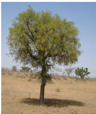
चित्र 16.3 खेजरी वृक्ष

अध्ययनों ने इस बात को स्थापित कर दिया है कि वनों के परंपरागत उपयोग के तरीकों के विरुद्ध पूर्वाग्रह का कोई ठोस आधार नहीं है। उदाहरणतः, विशाल हिमालय राष्ट्रीय उद्यान के सुरक्षित क्षेत्र में एल्पाइन के वन हैं जो भेड़ों के चरागाह थे। घुमंतु (खानाबदोश) चरवाहे प्रत्येक वर्ष ग्रीष्मकाल में अपनी भेड़ें घाटी से इस क्षेत्र में चराने के लिए ले जाते थे। परंतु इस राष्ट्रीय उद्यान की स्थापना के बाद इस परंपरा को रोक दिया गया। अब यह देखा गया है कि पहले तो यह घास बहुत लंबी हो जाती है, फिर लंबाई के कारण जमीन पर गिर जाती है जिससे नयी घास की वृद्धि रुक जाती है। संरक्षित क्षेत्रों में स्थानीय निवासियों को बलपूर्वक रोकने की प्रबंधन नीति संभवतः लंबे समय तक सफल नहीं हो पाई। किसी भी प्रकार से वनों को होने वाली क्षति के लिए केवल स्थानीय निवासियों को ही उत्तरदायी ठहराना ठीक नहीं है। हम औद्योगिक आवश्यकताओं एवं विकास परियोजनाओं जैसे कि सड़क एवं बाँध निर्माण से वनों के विनाश अथवा इसको होने वाली क्षति से आँखें नहीं मूँद सकते। इन संरक्षित क्षेत्रों में पर्यटकों के द्वारा अथवा उनकी सुविधा के लिए की गई व्यवस्था से होने वाली क्षति के बारे में भी विचार करना होगा।