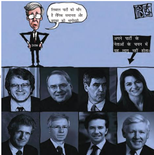
उदारवादी लैंगिक समानता