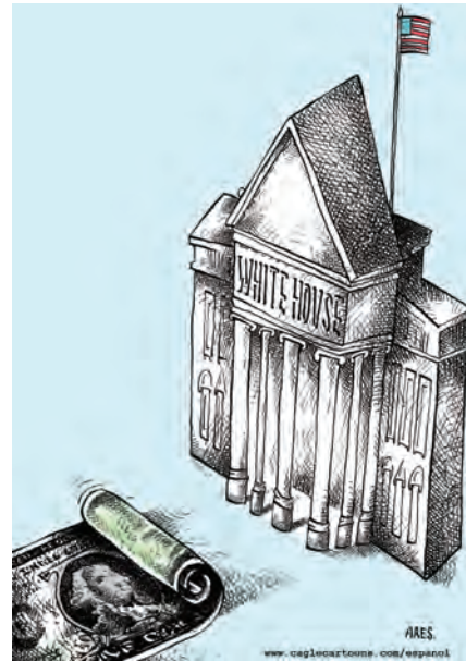
चुनाव अभियान का पैसा