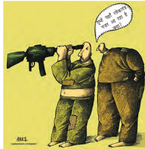
लोकतंत्र पर नज़र