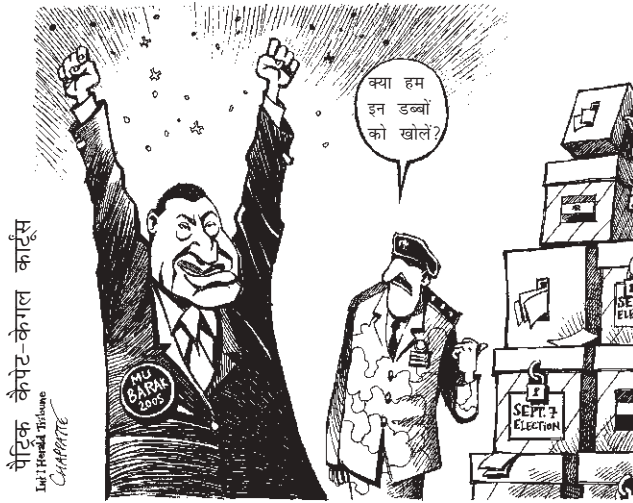
मुबारक फिर चुने गए

इनमें से प्रत्येक कार्टून लोकतंत्र की एक चुनौती को दिखाता है। बताएँ कि वह चुनौती क्या है? यह भी बताएँ कि इस अध्याय में चुनौतियों की जो तीन श्रेणियाँ बताई गई हैं, यह उनमें से किस श्रेणी की चुनौती है?