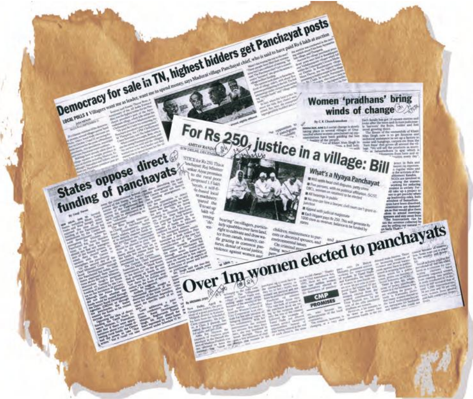
भारत में हुए विकेंद्रीकरण के प्रयासों के बारे में अखबार की इन कतरनों में क्या कहा गया है?

प्रधानमंत्री देश चलाता है। मुख्यमंत्री राज्यों को चलाते हैं। इसी तर्क से ज़िला परिषद् के प्रधान को ज़िले का शासन चलाना चाहिए। फिर, ज़िलों का शासन कलक्टर या ज़िलाधीश क्यों चलाते हैं?