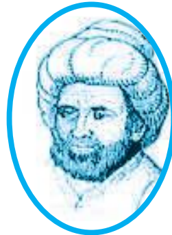
मुहम्मद इब्न मूसा अल-ख्वारिज़्मी (780 – 850 सा.यु.)

प्रमेयिका एक सिद्ध किया हुआ कथन होता है और इसे एक अन्य कथन को सिद्ध करने में प्रयोग करते हैं।