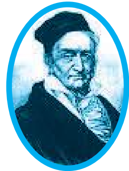
कार्ल फ्रैड्रिक गॉस (1777 – 1855)

अंकगणित की आधारभूत प्रमेय के रूप में विख्यात होने से पहले, प्रमेय 1.2 का संभवतया सर्वप्रथम वर्णन यूक्लिड के एलीमेंट्स की पुस्तक IX में साध्य (proposition) 14 के रूप में हुआ था। परंतु इसकी सबसे पहले सही उपपत्ति कार्ल फ्रैड्रिक गॉस (Carl Friedrich Gauss) ने अपनी कृति डिसक्विशंस अरिथमेटिकी (Disquisitiones Arithmeticae) में दी। कार्ल फ्रैड्रिक गॉस को प्रायः 'गणितज्ञों का राजकुमार' कहा जाता है तथा उनका नाम सभी समयकालों के तीन महानतम गणितज्ञों में लिया जाता है, जिनमें आर्किमिडीज़ (Archimedes) और न्यूटन (Newton) भी सम्मिलित हैं। उनका गणित और विज्ञान दोनों में मौलिक योगदान है।